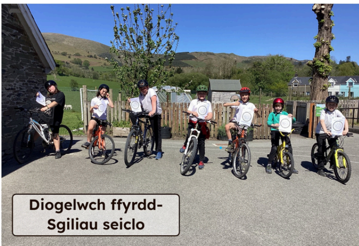
Diogelwch ffyrdd- Sgiliau seiclo

Cyflwynodd pawb yn y dosbarth eu pwyntiau pŵer gwybodaeth am y Mimosa o flaen y dosbarth i gyd! Roeddwn ni wedi mwynhau cyflwyno ar y sgrin newydd yn y neuadd. Ysgrifennwyd gan Curig blwyddyn 4